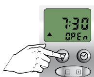
kort indrukken, OP tijd knippert