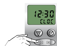
Stel huidige tijd in