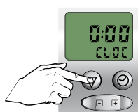
Vasthouden tot CLOC verschijnt